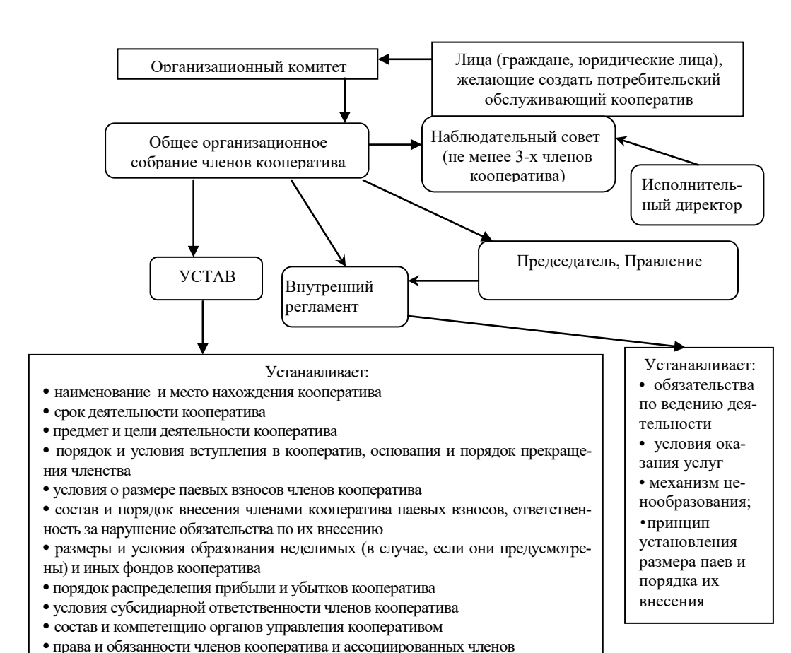
Рис. 1. Основные этапы работ по созданию и функционированию сельскохозяйственного потребительского кооператива

порядок и минимальный размер участия члена потребительского кооператива в хозяйственной деятельности кооператива, ответственность за нарушение обяза-